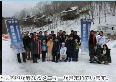
※写真は前回キャンプ風景であり、今回活動する体験メニューとは内容が異なるメニューが含まれています。